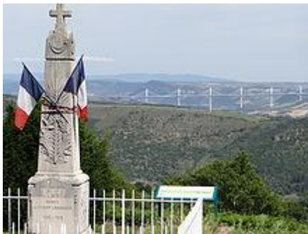
Le monument aux morts, devant le château, et le viaduc de Millau.

Les fontaines gothiques, Les sarcophages , Les cazelles, Les ruines du château vieux (XIII e siècle). Marzials[ Les remparts de l'ancienne cité. L'église du XV e siècle. La pierre à sacrifice.